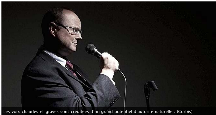
Les voix chaudes et graves sont créditées d'un grand potentiel d'autorité naturelle.

La voix influencerait la réussite professionnelle, selon une étude américaine. Des formations se sont développées en Suisse romande pour modifier son expression orale